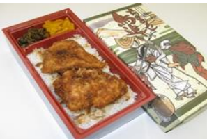
12/15(日) ソースカツ弁当(一例)