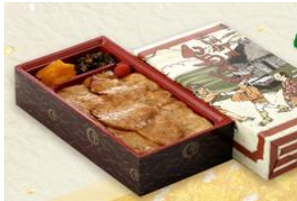
12/14(土) 鳥めし弁当(一例)

* 大会会場内「東武トップツアーズ専用デスク」にてお申込み単位毎に配布いたします。詳細は、予約確認書とともに、ご案内いたします。